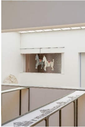
Ausstellungsansicht Bertille Bak. Voci dalla terra, Museo Vincenzo Vela, 2026